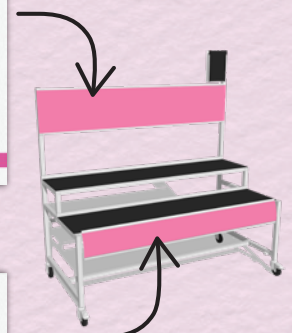
Affiche didactique (jupe) qui reprend les éléments du chromo - 182 x 21.5 cm